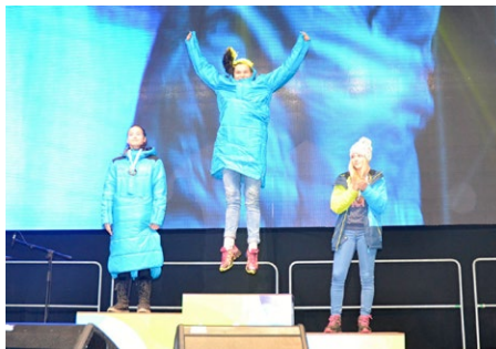
Z medailí na zimní olympiádě se nejčastěji radovala mládež z Libereckého kraje. Foto: Michaela Kubičková.

Celkem čtrnáct zlatých, patnáct stříbrných a deset bronzových medailí přivezli mladí sportovci z VIII. Her zimní olympiády dětí a mládeže ČR 2018, které se konaly v Pardubickém kraji. Liberecký kraj díky jejich skvělým výsledkům obsadil první místo mezi krajskými reprezentacemi, a to jak v bodovém hodnocení, tak co do počtu cenných kovů. Krajskou reprezentaci tvořilo dohromady 123 osob, z toho 94 sportovců a 29 trenérů. Mladí nadějní sportovci se utkali o medaile i bodová hodnocení v devíti zimních sportech – alpské lyžování, běžecké lyžování, biatlon, krasobruslení, lední hokej, lyžařský orientační běh, rychlobruslení, skicross, snowboarding a dvou doprovodných disciplínách – taneční soutěž a šachy. Mladí sportovci nasadili latku velmi vysoko, bude to pro ně velká výzva, protože Liberecký kraj převzal pomyslnou štafetu a bude pořadatelem letních olympijských her dětí a mládeže v roce 2019.